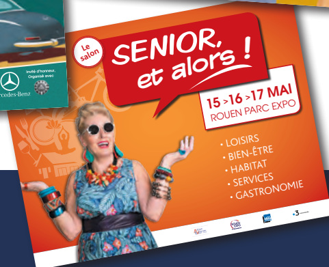
Affiches de salons grands formats