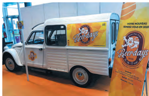
Objets, textiles, magnets, XPO, enrouleurs,...