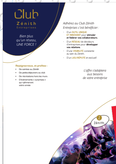
Outils promotionnels de présentation du Zénith de l'Agglomération de Rouen