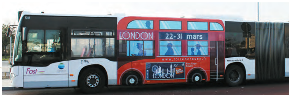
Covering partiel des bus de l'agglomération de Rouen